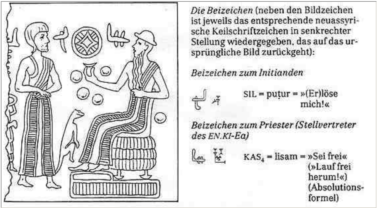
Abb. 4 Abdruck eines altassyrischen Rollsiegels aus dem 23. Jahrhundert v. Chr. (Ausschnitt). Der Priester wirkt als Stellvertreter des Gottes der Erde, EN.KI-Ea-Henoch , und hält den Erdtrabanten Mond fest. Aus: Papke, Werner: Die geheime Botschaft des Gilgamesch, Abb. 41.

sowie von fünf Kugeln, welche offenbar die fünf mit bloßem Auge sichtbaren Planeten Merkur, Venus, Mars, Jupiter und Saturn bedeuten. Als "Eingeweihter" des EN.KI-Ea-Henoch, des "Herrn der Erde", vertritt auch der Priester auf diesem Abdruck den Planeten Erde selbst; deshalb hält er den Mond, den Satelliten der Erde, wie die Erde (in seiner Hand) fest. Der Mond ist als kleines Schälchen geformt, das den berausenden Trank enthielt, den der Initiand trinken mußte.