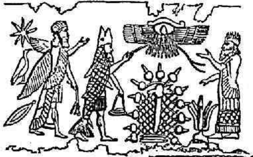
Abb. 6 Diese Abrollung eines neuassyrischen Rollsiegels zeigt den Pontifex Maximus , den Stellvertreter des Gottes der Erde , EN.KI-Ea-Henoch-Mithras', mit der Fisch-Mitra am Weihnachtsbaum , der 13 Kugel-Früchte trägt. Darüber schwebt als allsehendes Auge der assyrische Sonnengott Sem . Die Mutter Assurs, des Sohnes Sems, wird als achtstrahliger Venusstern dargestellt. Der König vertritt den erwarteten Welterlöser von AsSyrien, den Sohn Sems, den Antichrist. Aus: Layard, Austen Henry: Babylon and Nineveh .

Frucht vom " Baum des Lebens ", vom Weihnachtsbaum , angespielt wird, die der König nach seinem Tod im Abgrund (Apsu) einmal essen wird (siehe in Abb.1, Mitte, den Pinienzapfen an dem Stab unterhalb der Hand). Noch heute tritt der Oberste Weihnachtsmann mit seiner Fisch-Mitra auf dem Haupt als Stellvertreter des Gottes der Erde am 25. Dezember zu der auf dem Petersplatz in Rom wartenden Menge heraus und erteilt den Segen urbi et orbi für Rom und die ganze Ökumene. Und alle, die ihm zuhören, erhalten die Absolution. Mit der Geburt Jesu hat das ganze babylonische Brimborium rein gar nichts zu tun!