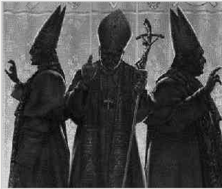
Abb. 1 Drei Päpste in Aktion

Weihnachten ist kein christliches Fest, es hat auch nichts (!) mit der Geburt Jesu zu tun. Denn Jesus wurde im Jahre 2 v. Chr. am 30. August nach Sonnenuntergang gegen 18.30 Uhr in Bethlehem geboren, als gleichzeitig am Himmel im Schoße der Jungfrau ERUA, des uralten Zeichens der Mutter des schon in Eden verheißenen Erlösers, plötzlich ein neuer Stern strahlend erschien (siehe mein Buch DAS ZEICHEN DES MESSIAS). An diesem warmen Sommerabend, an dem die Jungfrau Maria von dem Knaben Jesus entbunden wurde, begann mit dem Erscheinen der Neulichtsichel des Mondes über dem Westhorizont der 1. Tischri , der jüdische Neujahrstag (Rosch ha-schana). Dennoch feiern Millionen ahnungsloser Menschen auf der ganzen Welt die Geburt Jesu zu Weihnachten , am 25. Dezember - "mitten im kalten Winter", wie es in einem altkatholischen Weihnachtslied heißt. Und sie glauben, Gott damit noch einen Gefallen zu tun. Wenn diese Menschen wüßten, was Weihnachten wirklich ist, würden sie ihren Weihnachtsbaum samt Lametta , Kerzen und " Christ " baum-Kugeln sofort aus dem Fenster werfen.