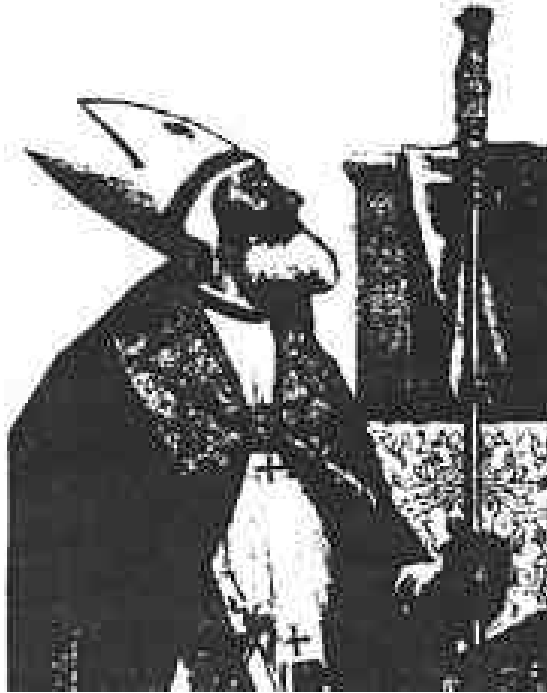
Abb. 5 Der Mailänder Bischof Ambrosius, gemalt von Moretto. Deutlich zu erkennen ist sogar das Fischauge auf der Mitra.